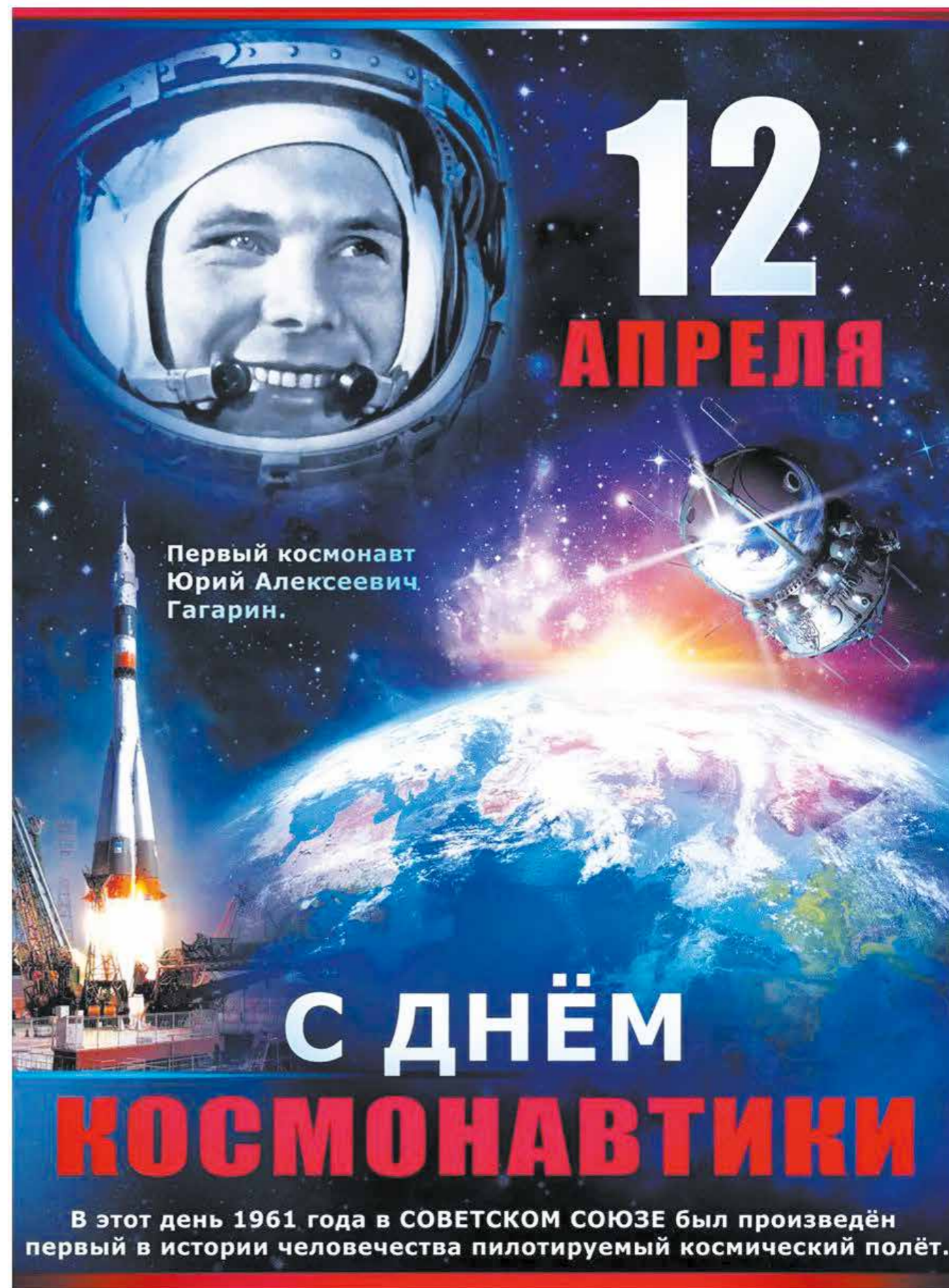
Первый космонавт Юрий Алексеевич Гагарин.

Ученые продолжают поиски новых технологий лечения и, как рассказал Масчан, разрабатывают мультиспецифичные клетки, которые нацелены сразу на несколько молекул на поверхности опухоли. Если обычные CAR-T-клетки запрограммированы воздействовать на одну конкретную молекулу на поверхности новообразования, то мультиспецифичные клетки распознают несколько молекул на опухоли одновременно, что увеличивает шансы на исчезновение рака. Специалисты также разработали такие CAR-гены, которые напрямую доставляются в организм пациента и перепрограммируют T-клетки непосредственно внутри человека — такая технология получила название in vivo CAR. Как пояснил Масчан, вирусная частица, которую вводят пациенту, сама находит лимфоциты и изменяет их внутри организма. Первые результаты исследования такого варианта лечения уже опубликованы китайскими учеными.